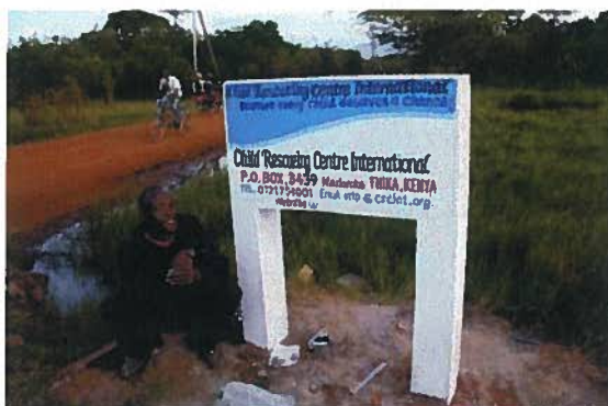
de schilder van het betonnen bord

Uiteindelijk heeft bestuurslid Yvette Boltze in december een nieuw betonnen naambord laten plaatsen. Aan het begin van het pad heeft een metalen naambord gestaan. Deze is ongeveer een jaar geleden gestolen.